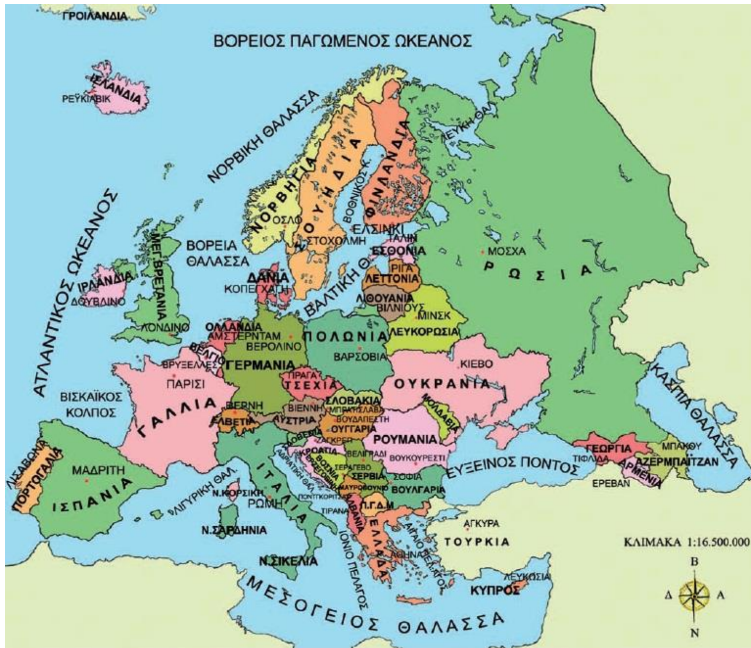
Εικόνα 29.1: Πολιτικός χάρτης της Ευρώπης κατά το έτος 2006-2007